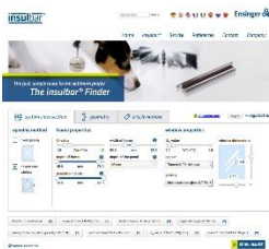
Immagine 1: insulbar finder di Ensinger guida online l'utente passo dopo passo, sino al profilo isolante ideale.