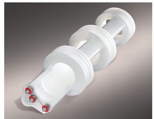
Giunto per carrello per aeromobile.