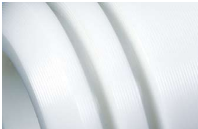
Nuovo TECAPET (dettaglio)