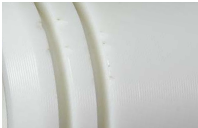
Normale PET (dettaglio)